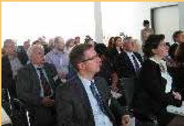
Participants au séminaire

Ce séminaire a permis de formuler des lignes directrices et/ou des principes permettant de soutenir l'assurance de la qualité dans l'EPF initial et continu dans le secteur des TIC. Vous trouverez ces éléments dans la synthèse du séminaire.